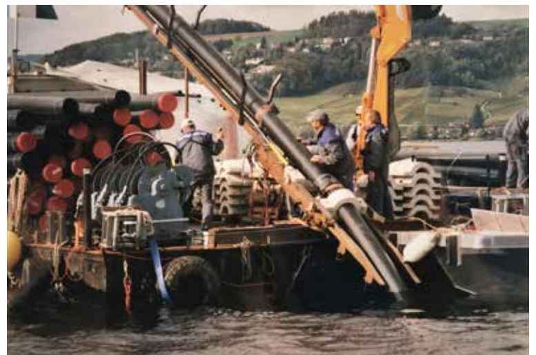
Pose de la conduite à travers le lac de Morat (2001)

juin 2000 le visage de l'association ABV, regroupant les 20 communes de la région Broye/Vully, prit forme.