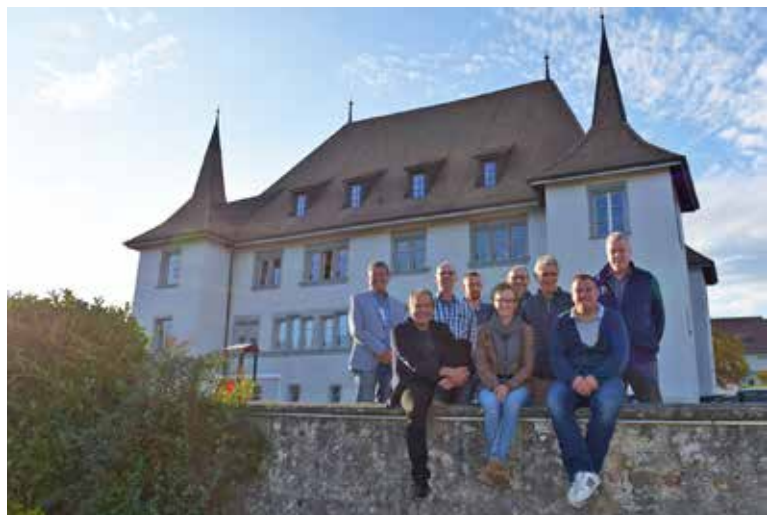
Bureau exécutif de l'ABV 2016-2021

Au niveau politique, chaque commune de l'ABV est représentée au comité de direction ainsi qu'à l'assemblée des délégués avec un ou deux représentants. Un bureau formé de