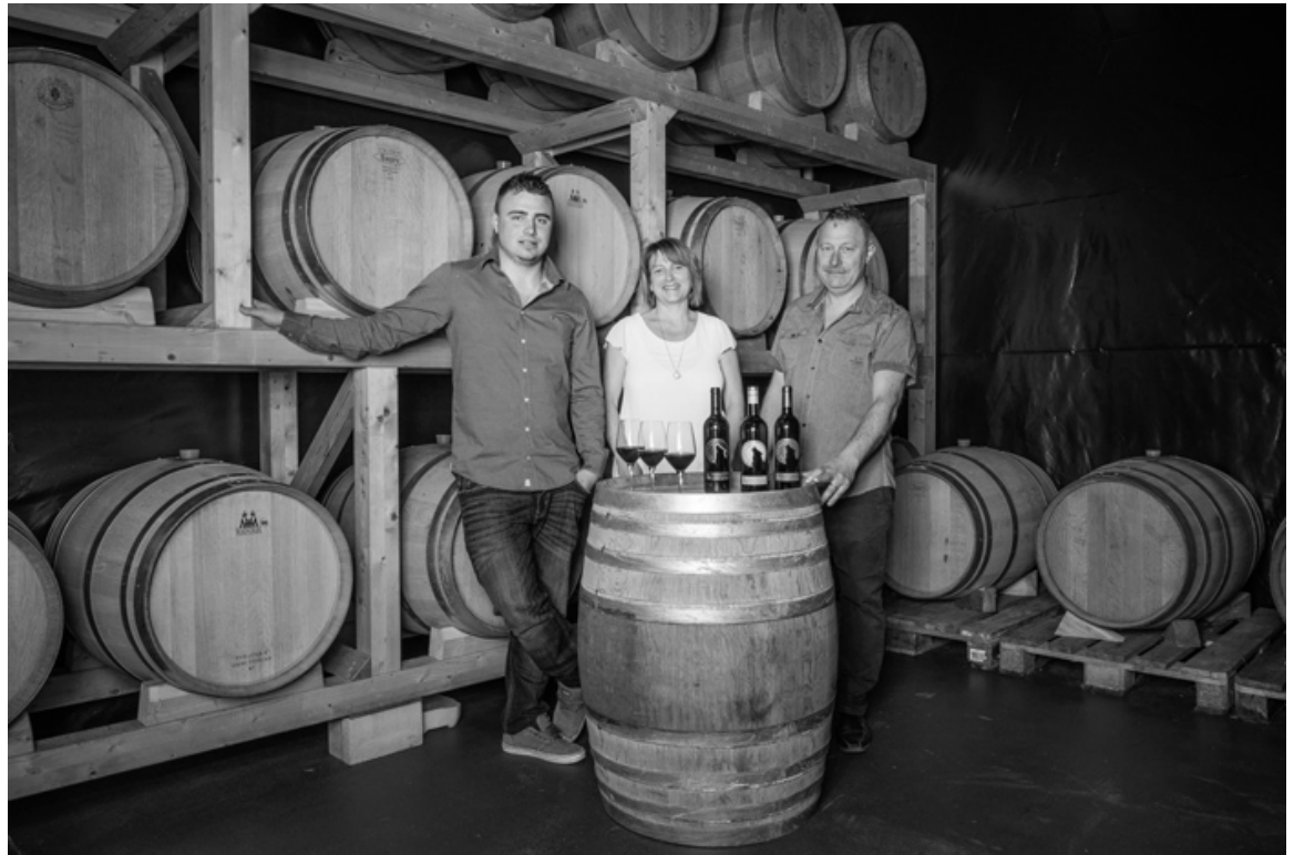
La famille Loup dans les Caves du Château de Montmagny

Le raisin de cuve, uniquement rouge est très beau, il n'a pas été affecté par la grêle des chaudes journées de l'été qui se termine et promet une belle récolte. A présent, quelques rayons