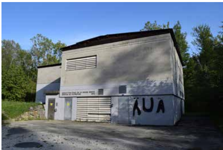
Station de filtration de Portalban

l'ABV dispose désormais d'un potentiel convenable, fiable et bien entretenu. L'association alimente une population de 20'000 habitants résidents à l'année, allant jusqu'à 40'000 habitants durant l'été avec les nombreux