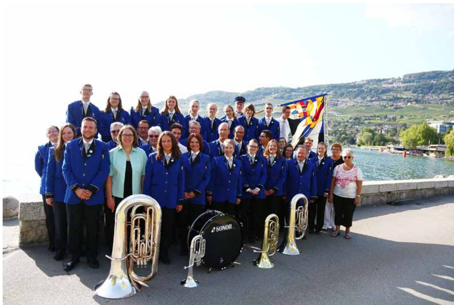
La Caecilia lors de la Fête des Vignerons à Vevey