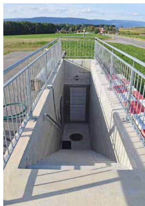
Station de pompage de Delley (2017)

cinq membres, issus des communes, du fontainier, de l'ingénieur-conseil, du comptable et de la secrétaire, est responsable du fonction-