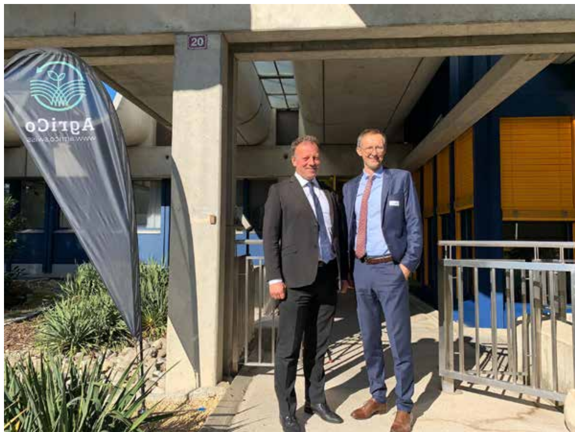
Didier Castella et Olivier Curty, Conseillers d'Etat

Bee Vectoring Technology (BVT) a mis au point une technologie révolutionnaire qui utilise les abeilles pour assurer une protection ciblée des cultures grâce au processus naturel de pollinisation. Selon le magazine Forbes, BVT est l'une des cinq entreprises les plus prometteuses au monde.