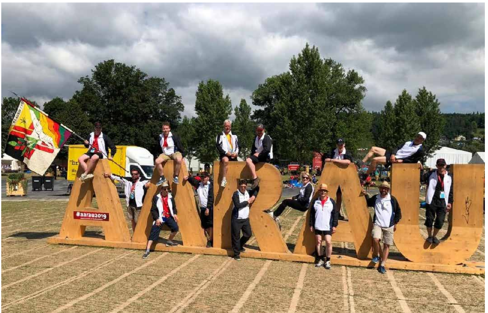
Le groupe polysport adulte lors de la Fête fédérale

La GR a fourni un dernier effort le 29 juin lors de sa porte ouverte, qui a connu un grand succès. Le groupe danse moderne a également fait salle comble lors de son petit spectacle de fin