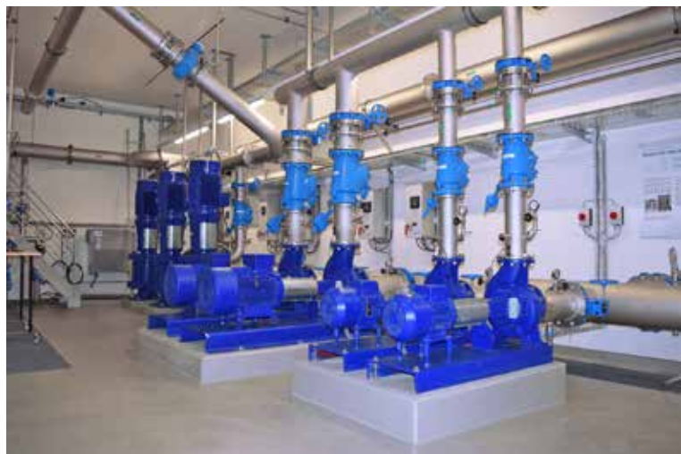
Mise en service de la station d'ultra-filtration de Cudrefin (2013)

cinq membres, issus des communes, du fontainier, de l'ingénieur-conseil, du comptable et de la secrétaire, est responsable du fonction-