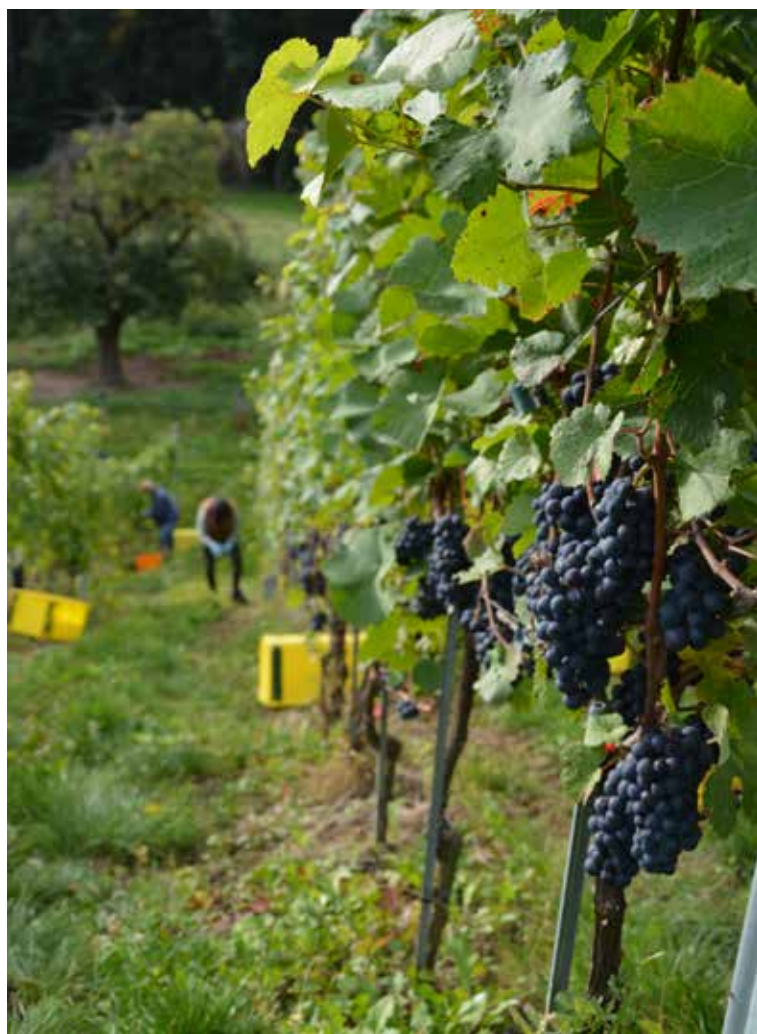
La vigne du Craux