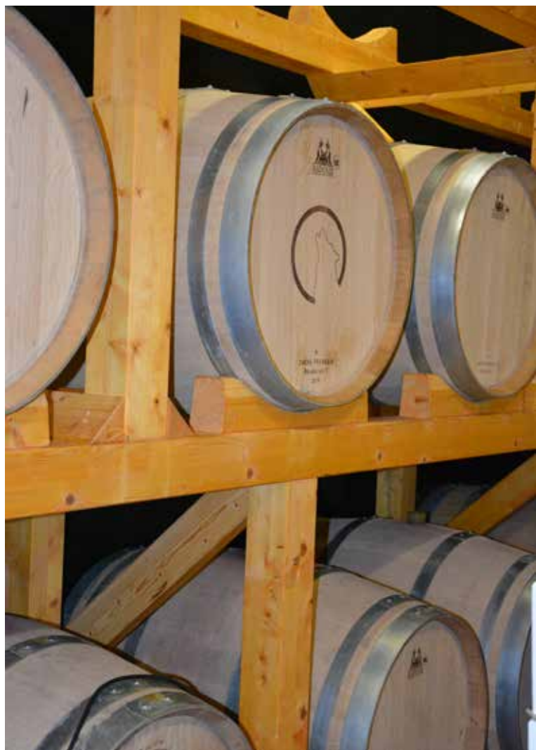
Les barriques de la Cave du Château dans lesquelles vieillira le vin de la commune