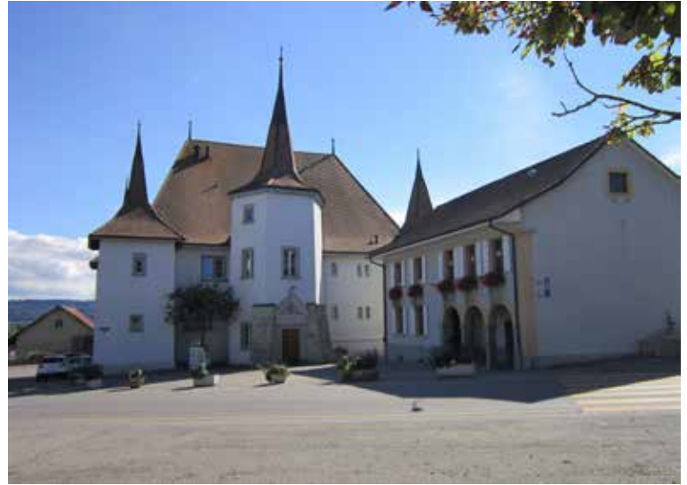
C'est à l'intérieur du château de St-Aubin que se trouve la garderie les P'tits Pruneaux

Il fallait, avant même d'imaginer créer une structure comme celle des P'tits Pruneaux, connaître les besoins des habitants à ce sujet. L'enthousiasme est alors général pour un petit comité de parents, soutenu par le conseil communal, lorsque le village semble se montrer favorable à la concrétisation