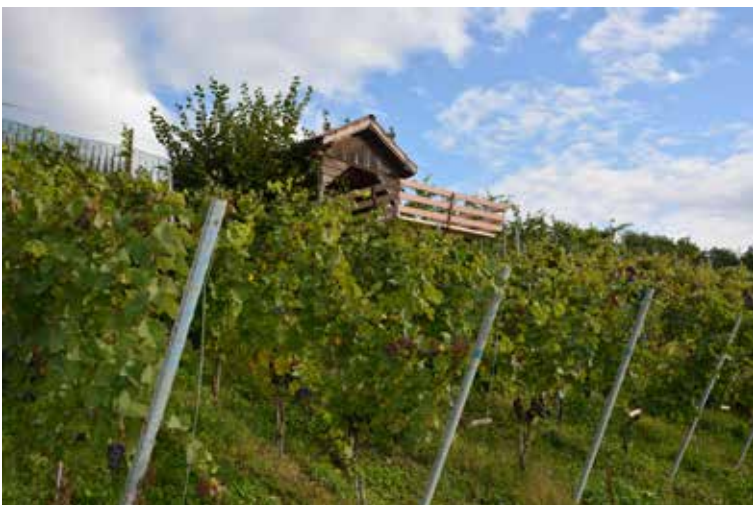
La cabane surplombant les 2500 m2 de vigne