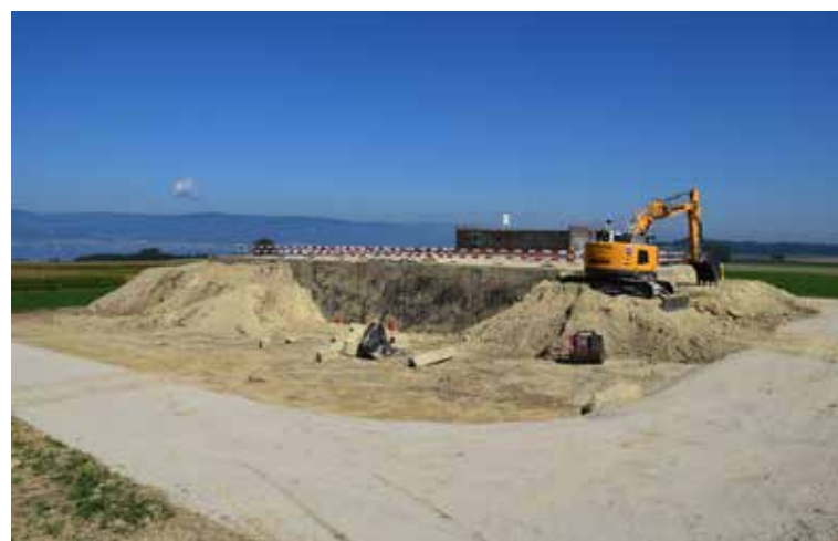
Agrandissement du réservoir Le Mont à St-Aubin (2019)